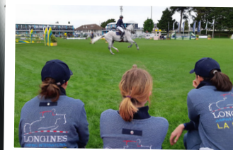
Saumur Jumping La Baule CSO Ste-Foy