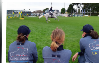
Saumur Jumping La Baule CSO Ste-Foy