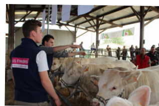
Vente aux enchères Tech'Elevage

Formation initiale ou en apprentissage, en présentiel Non accessible par la VAE Validation de la formation complète uniquement Pas de possibilité d'acquiescer des blocs de compétences selon le niveau d'entrée en formation Pas d'équivalences ou de passerelles possibles