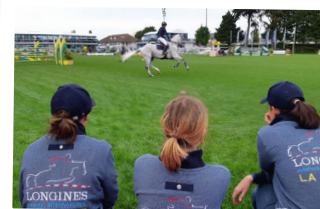
CCI*** Saumur Jumping La Baule CSO Ste-Foy